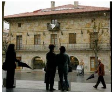
El edificio del Consistorio de Galdakao./ MITXEL ATRIO