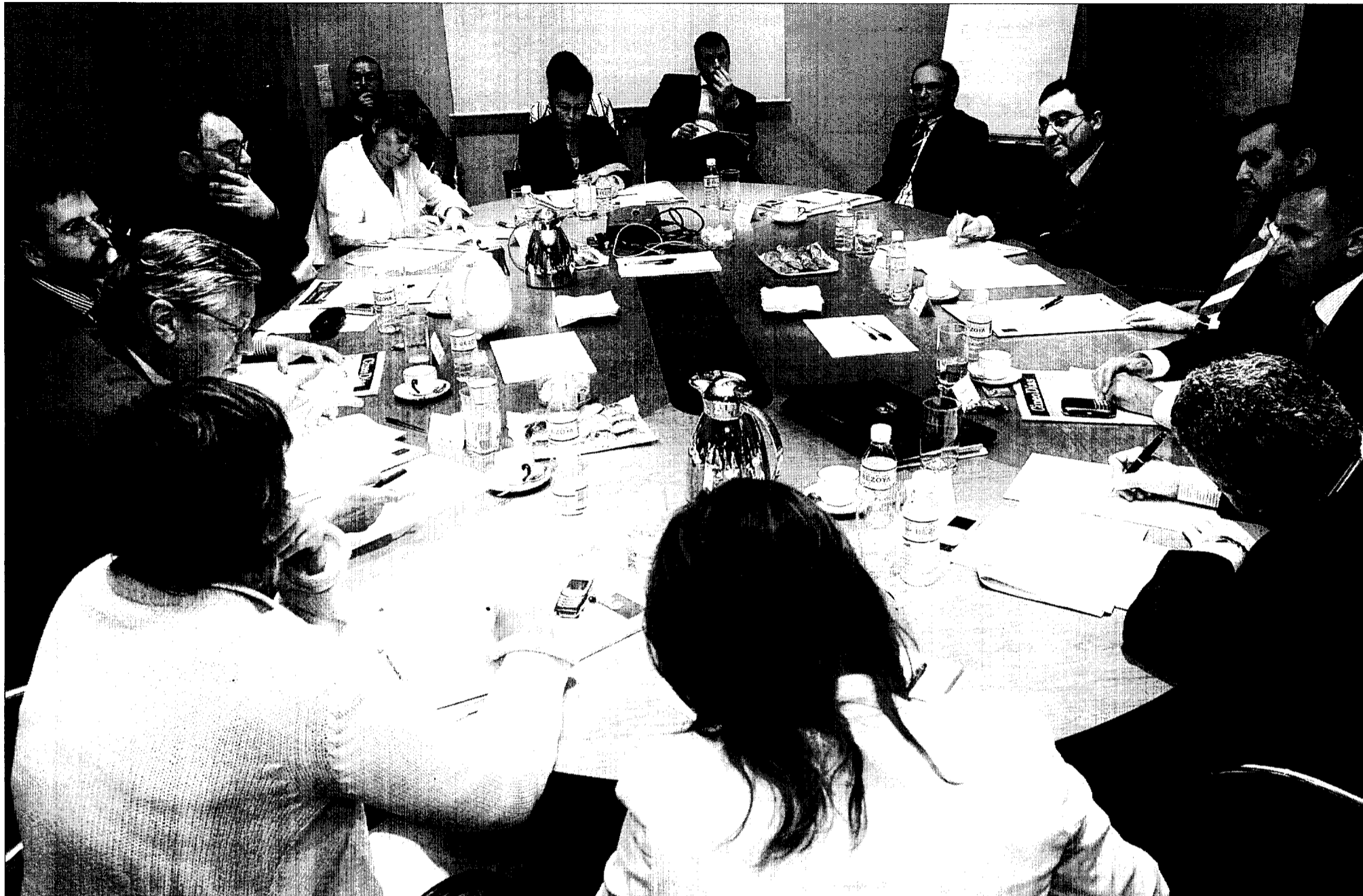
Esta semana ocho expertos debatieron sobre el Estado y retos de la Administración electrónica en España. El encuentro inauguró la Mesa de las TIC, una reunión profesional sobre Tecnologías de la Información y la Comunicación, organizado por Red.es, T-Systems y Cinco Días. PABLO MORENO